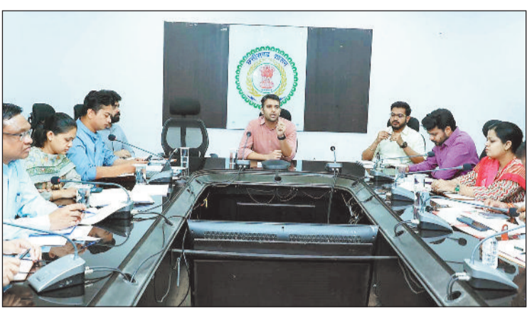
बैठक लेते कलेक्टर और उपस्थित अधिकारी।

कलेक्टर ने राज्य शासन की प्राथमिकता वाली महतारी वंदन योजना की ईकेवाईसी की प्रगति की भी गहन समीक्षा की। बैठक में बताया गया कि जिले में वर्तमान में 2 लाख 81 हजार 135 लाभार्थी पंजीकृत हैं, जिनमें से 1 लाख 24 हजार 449 हितवाहियों के बैंक