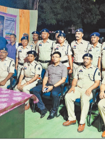
सायबर सुरक्षा यातायात नियम और वरिष्ठ नागरिकों के सम्मान जैसे अहम मुद्दों पर लोगों को जागरूक किया गया।