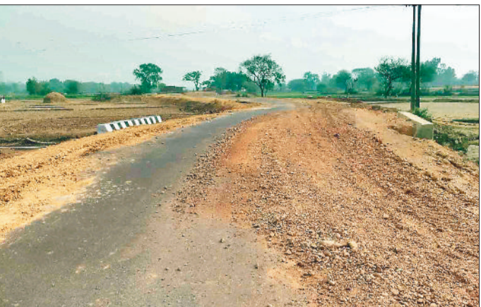
नवनिर्मित सड़क पर बिखरे मुरुम पत्थर।

क्षेत्र के ग्राम पंचायत सलका रजवाड़ी पारा से रेड नदी तक हाल ही में निर्मित डामरीकृत सड़क एक बार फिर चर्चा का विषय बन गया है। इस बार कारण गुणवत्ता नहीं बल्कि ठेकेदार की लापरवाही है। ग्रामीणों का आरोप है कि सड़क निर्माण के बाद अब किनारों पर डाले जा रहे मुरुम पत्थर के कारण पूरी सड़क की हालत बिगड़ती जा रही है। ग्रामीणों के अनुसार सड़क का निर्माण अच्छे स्तर पर किया गया है और डामरीकरण भी संतोषजनक था। लेकिन अब सड़क के दोनों किनारों पर जो